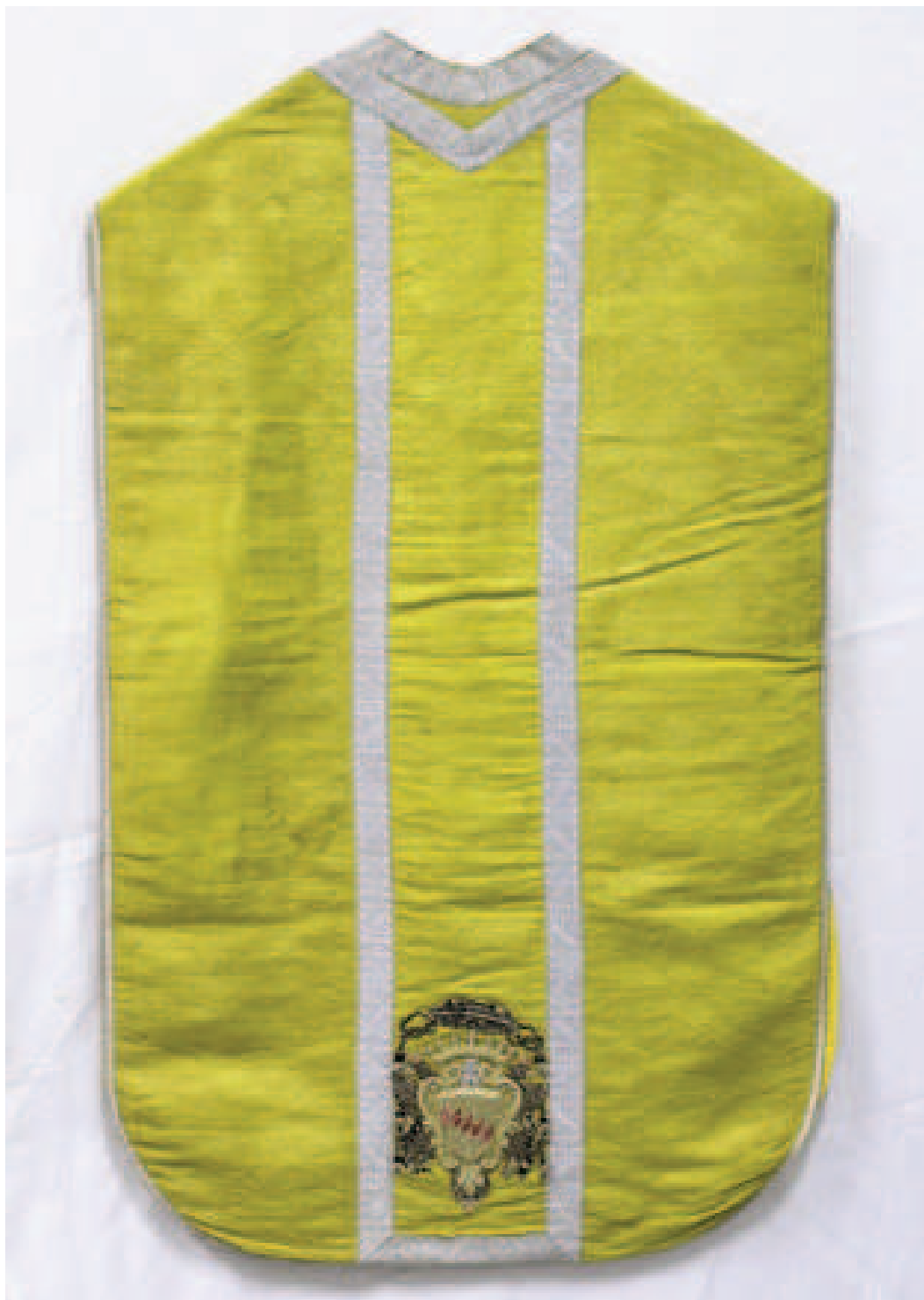
Pianeta in teletta d'oro con stemma Bardi, del XVIII secolo

patì el nostro signore Iesu Christo pena et passione per noi miseri peccatori, et similmente sette Pater noster et sette Ave Maria per l'anime de' morti, et ancora un Pater noster et una Ave Maria quando si pone a mangiare, et similmente quando se ne leva e à mangiato. Et ancora vogliamo che ciascheduno si debbi comunicare ogni quattro mesi una volta .... Ancora vogliamo che tutti e' nostri fratelli osservino e' precetti et comandamenti della santa Chiesa ...».