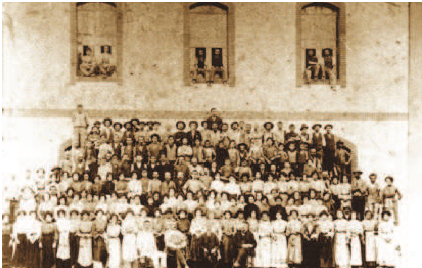
Operai del Mulinnovo a Mercatale di Vernio, 1897

«distribuzioni del pane e del vino», venivano «dispensati i moccoli» o «candelotti», ovvero delle piccole candeline 73 .