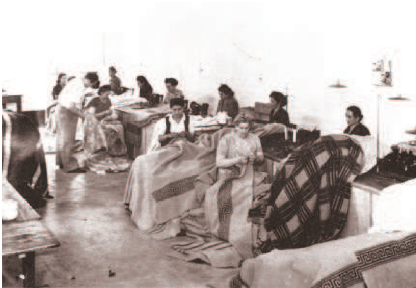
Sopra, fabbrichine del Lanificio Val Bisenzio al rammendo delle coperte

l'ottava del Corpus Domini, l'Opera del SS. Crocifisso doveva pagare al camarlingo della compagnia 4 scudi, ossia 28 lire, per solennizzare con 12 messe la festa più importante del borgo di Mercatale. Il 16 giugno 1757, giorno dell'ottava del Corpus Domini, fra le entrate della compagnia sono infatti segnalati 4 scudi «per tanti riceuti dalla Santa Macii, nostra sagrestana e cercante, che scudi 3.3 serviti per n. dodici messe per i benefattori dell'altare del SS.mo Crocifisso, celebrate in questo giorno, e lire 4 per lacero di cera servita per il detto altare» 62 .