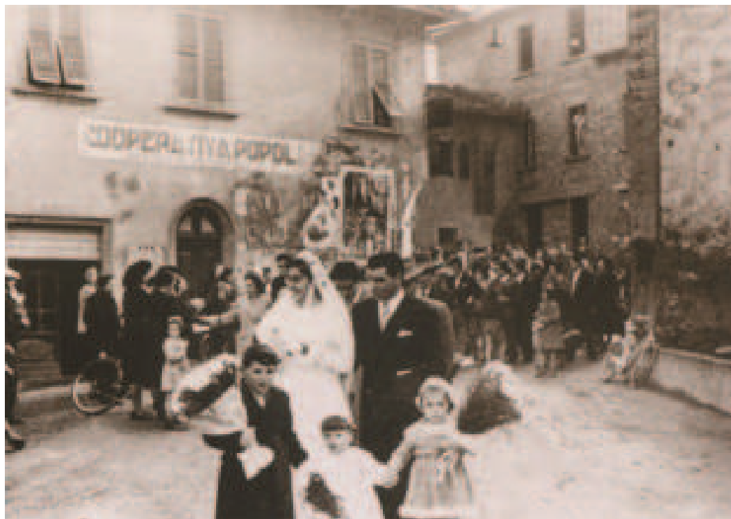
Matrimonio a Mercatale di Vernio

no lo sciopero. Solo l'8 agosto la vertenza venne risolta con la concessione di una indennità mensile di caroviveri, oltre agli aumenti precedentemente accordati dalla ditta.