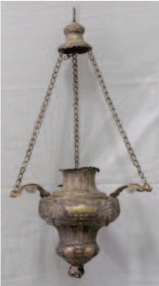
Sopra, a sinistra. L'altare maggiore dell'antica chiesa della Compagnia del SS. Sacramento di Mercatale di Vernio. Sopra, a destra. Ostensorio dell'argenteiere granducale Bernardo Holzmann, dei primi del XVIII secolo. A lato, lampada pensile in argento, di bottega fiorentina, del 1765