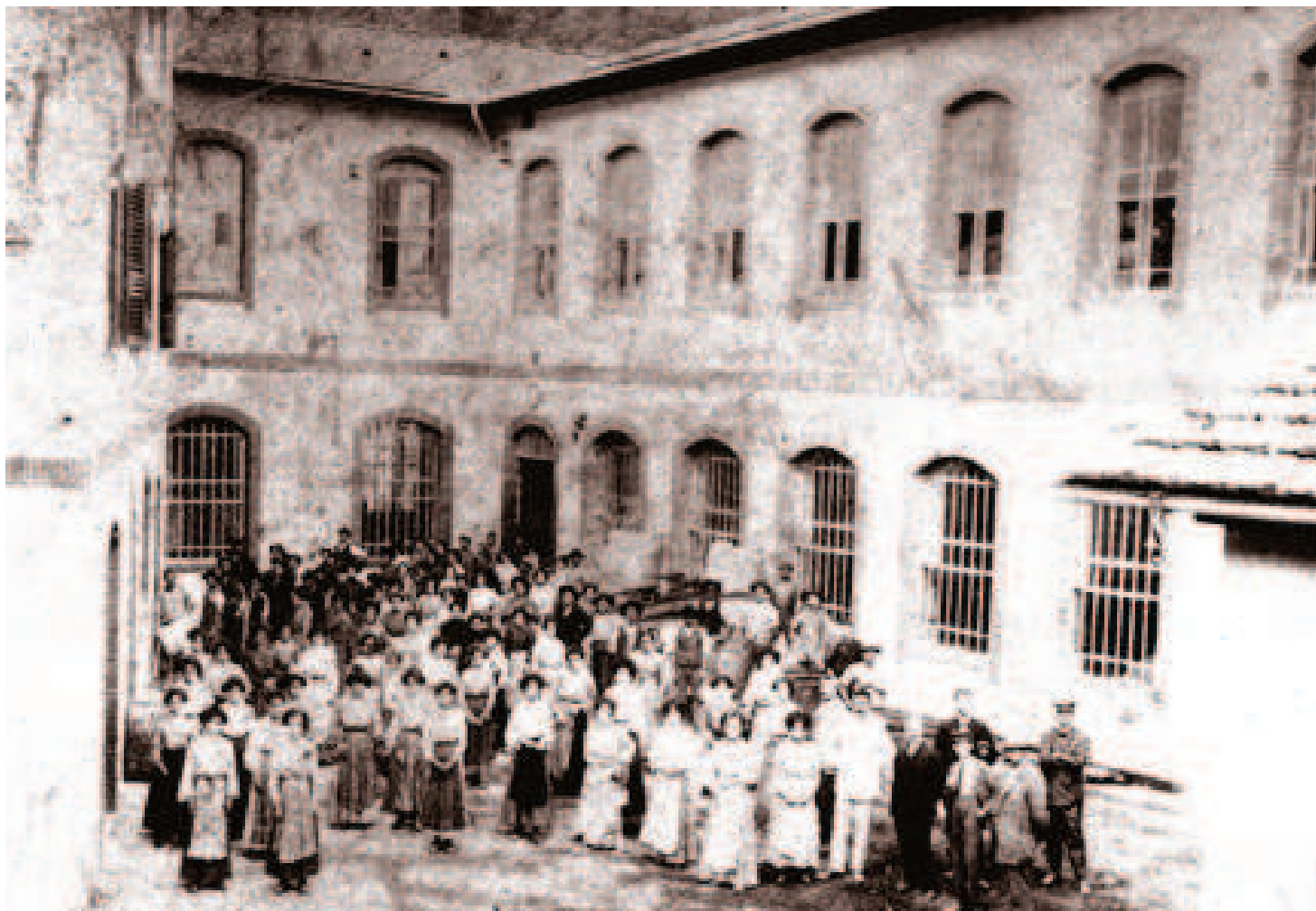
Operai del Lanificio Val Bisenzio, 1897

belle colonne d'arenaria» 58 . Il maggiore era ornato da una pala dipinta nel 1758 dal «signor Giuseppe Becchetti, pittore di Bologna» 59 ed era stato privilegiato di indulgenze da applicarsi ai defunti con una lettera del 19 novembre 1759 del papa Clemente XIII 60 ; i laterali, tutti adorni di tele dipinte, erano dedicati a sant'Antonio da Padova, al SS.mo Crocifisso, alla Madonna del Rosario e a san Giuseppe.