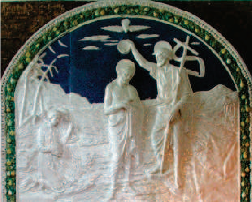
Battistero di S. Quirico di Vernio, del padre Edoardo Rossi

Zedda di Mercatale di Vernio. Caddero il 21 gennaio 1936 117 . Un'altra pagina triste della storia del borgo fu scritta nel 1944. Iniziò nell'aprile, quando uno spezzonamento di aerei alleati cercò di colpire alla stazione di Vernio un treno carico di munizioni. Il 18 maggio, giorno dell'Ascensione, il violentissimo bombardamento che distrusse la stazione di Vernio, colpì anche alcuni stabilimenti industriali e numerose abitazioni private di Mercatale. Molta gente rimase senza casa e senza lavoro. Furono in parte distrutte o gravemente danneggiate le fabbriche Meucci (circa 2500 mq.), Santi Diego (circa 800 mq.) e Fratelli Tendi (circa 300 mq.). Sulla fine di agosto i tedeschi in ritirata, per ostruire e rendere impraticabile la strada che portava al nord, fecero saltare in aria alcuni edifici del Borgo e i due ponti esistenti 118 .