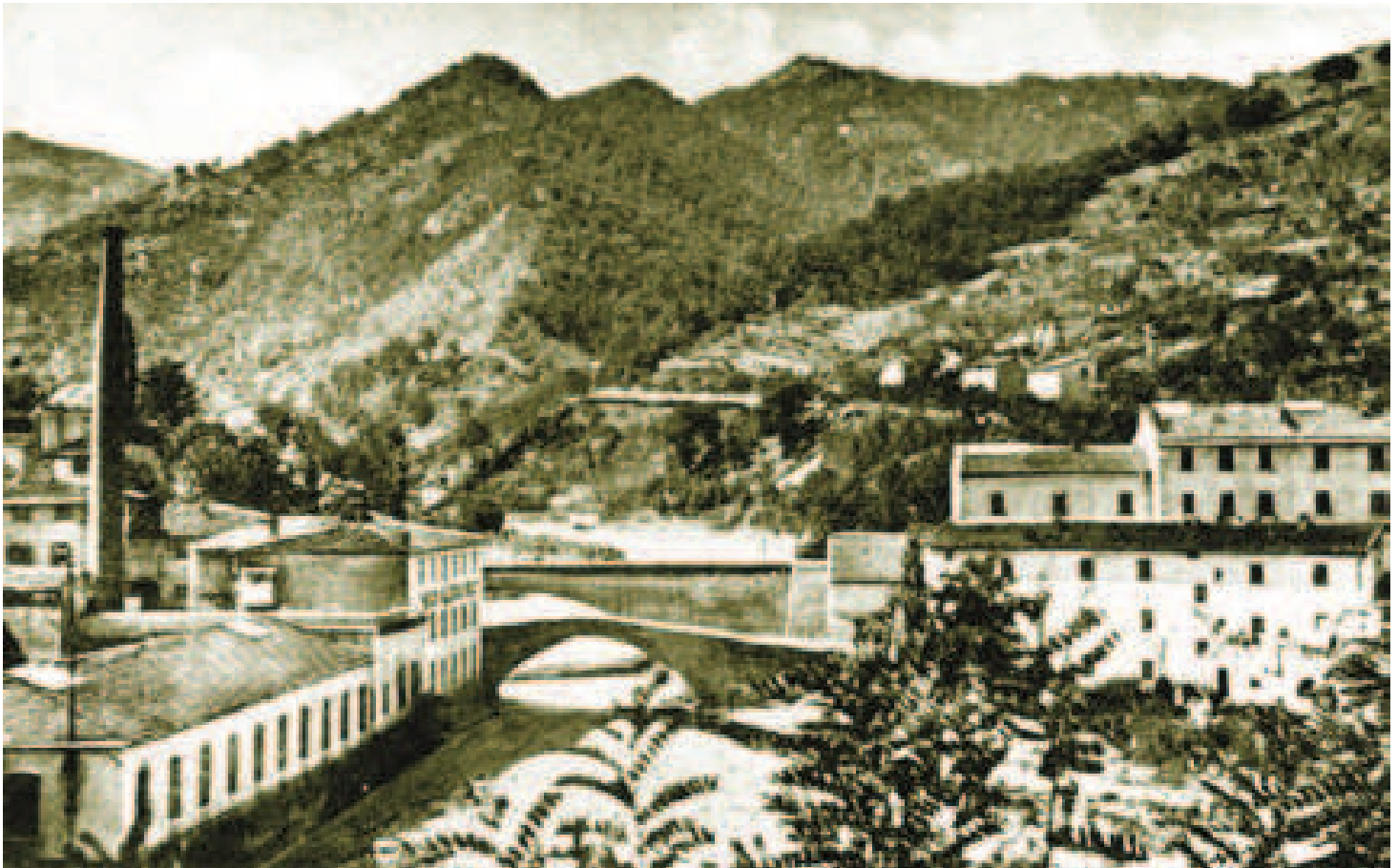
Carbonizzo Meucci a Mercatale di Vernio